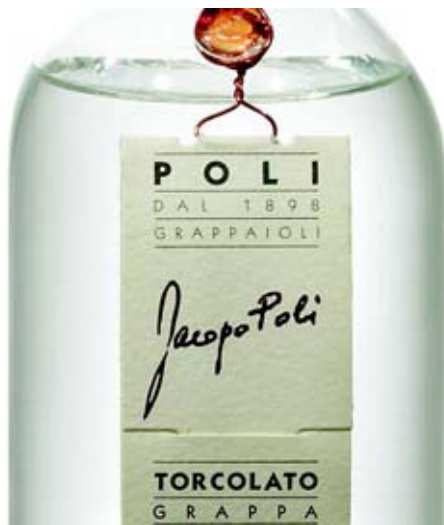
"רזה, מהודקת, מיוחדת, עם סיומת מופלאה של פרחים ופירות לא שגרתיים בעליל. תוספת של גומי חרוך מביאה אותה לרמה אחרת."