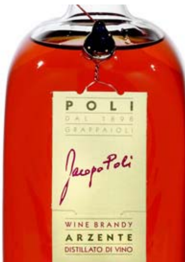
"מורכב, קטיפתי, ספקטרום אדיר של ריחות. זיקה לכמה סוגים של משקאות משובחים כמו קוניאק וארמניאק, וויסקי סינגל מאלט, גראפה ומאר דה בורגון, אבל ההרמוניה הכללת לא דומה לאף אחד מהנ"ל."